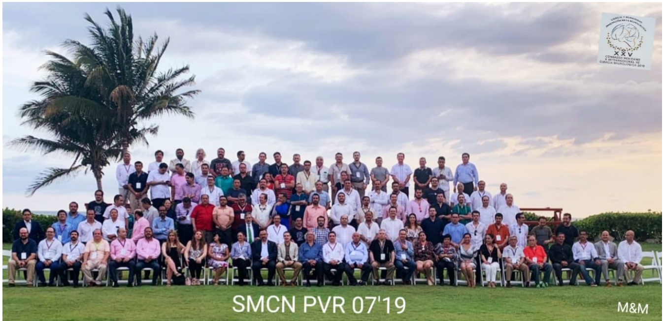
Foto oficial del XXV Congreso Mexicano e Internacional de Cirugía Neurológica 2019.