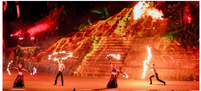
Espectáculo de acrobacia y danzas folklóricas Savia, Puerto Vallarta, Jalisco, México.

ron recursos en su organización, resaltando la cena/espectáculo Savia, con un franco matiz de costumbres y trajes regionales mexicanos, además de acrobacias aéreas que impresionaron a los asistentes.