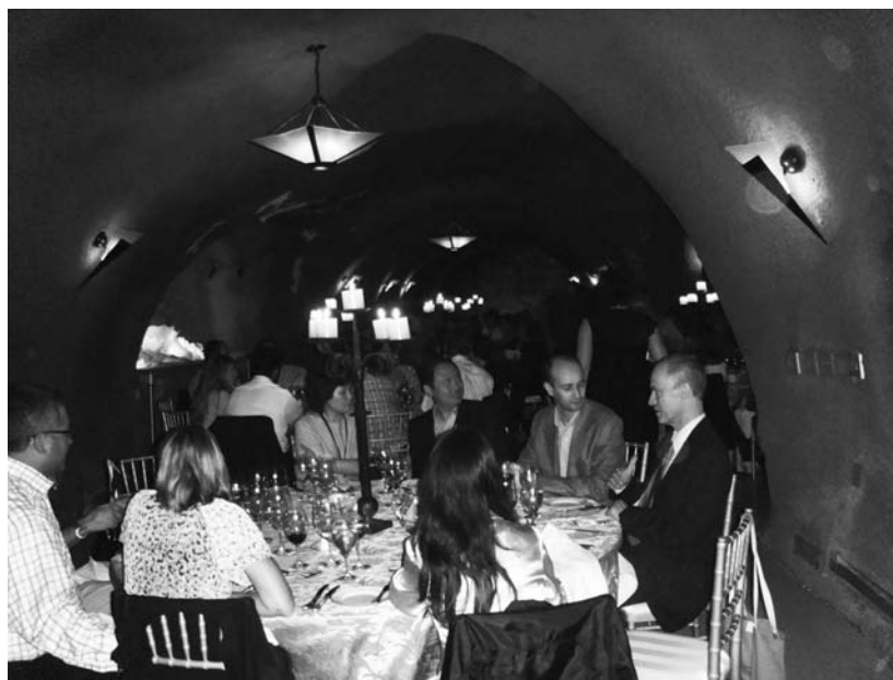
Durante cena de camaradería en la bodega vitivinícola "Pidge Ridge Winery".