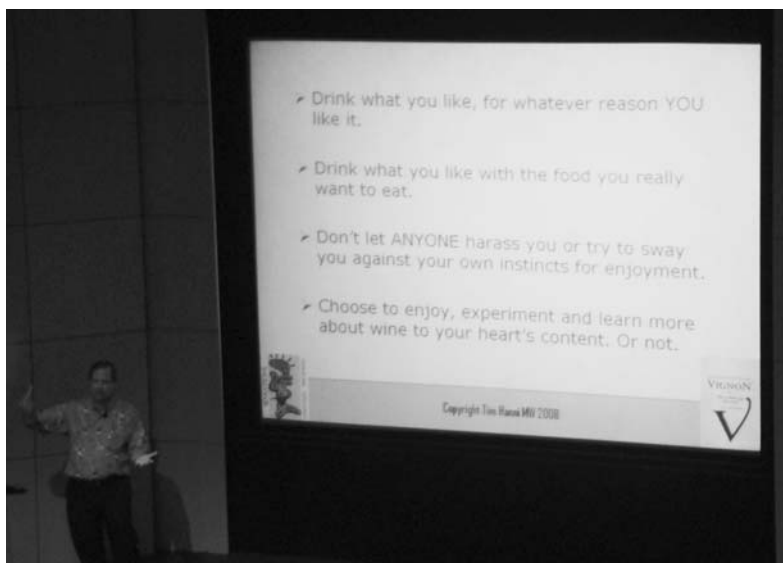
Foto de presentación del Wine & Neuromodulation.

En conjunto, toda la conferencia fue científica y prácticamente ilustrativa, de ese modo aprendimos sobre técnicas guiadas por Ultrasonido, estimulación de tejido subcutáneo para Dolor Facial Crónico, el nuevo algoritmo para Estimulación Cordonal Posterior basado en las conclusiones de un panel de discusión sobre Polialgesia, etc.