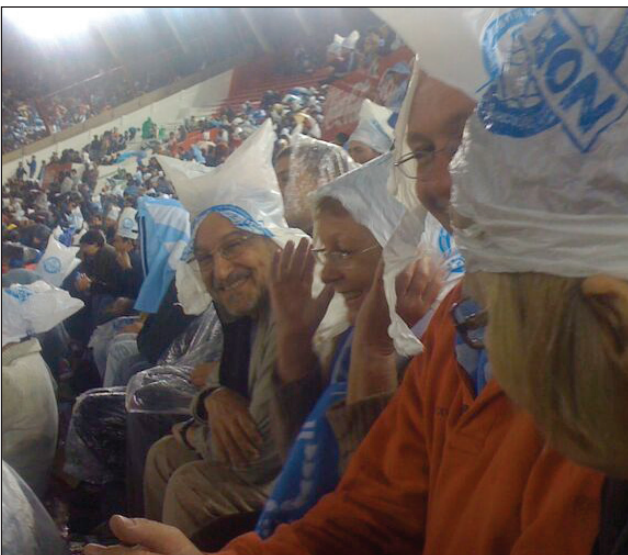
Foto 3. En el partido Argentina-Perú por las eliminatorias al mundial de fútbol Sudáfrica 2010. (Buenos Aires 2009)