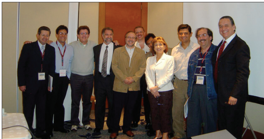
Foto 2. Con autoridades de FEDELAT y capítulos latinoamericanos de dolor durante el VIII Congreso Chileno de Dolor (Santiago de Chile, año 2008)