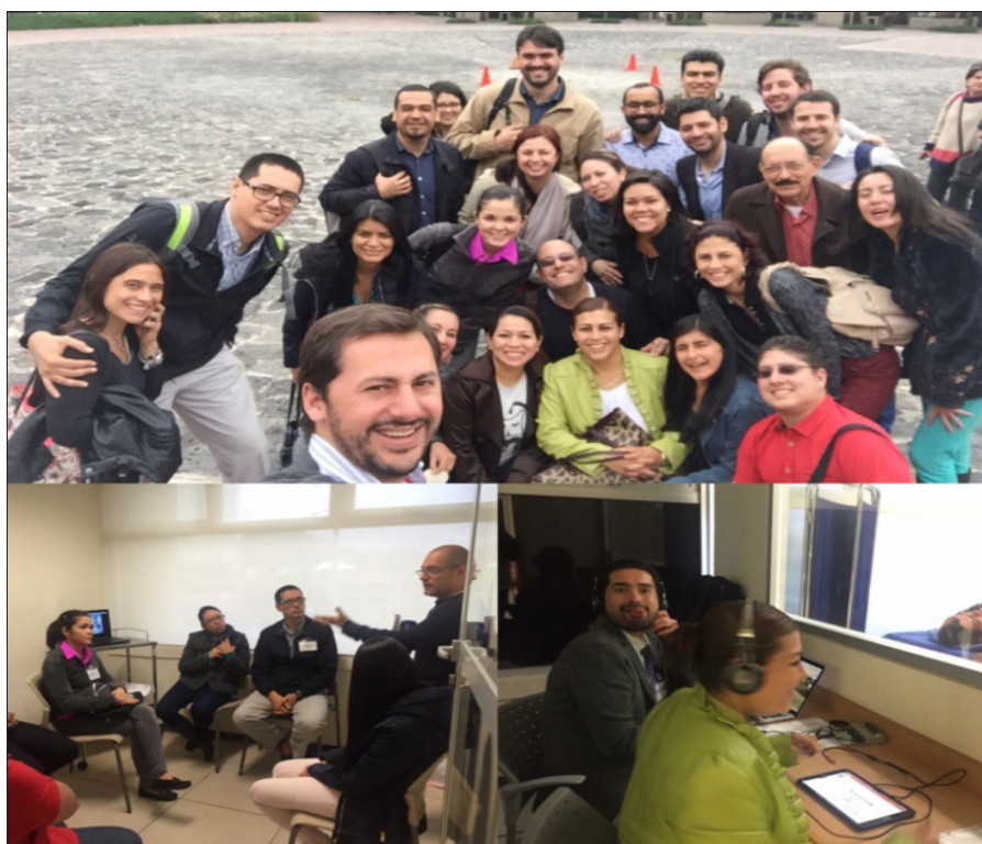
Figura 1. Asistentes y actividades realizadas en el IASP Pain Management Camp en la Ciudad de México (Octubre, 2016). Curso AADA™ Simulación by Algia ©.

Con una duración de cinco días se desarrollaron destrezas y se impartieron conferencias a un grupo de 28 profesionales (Figura 1).