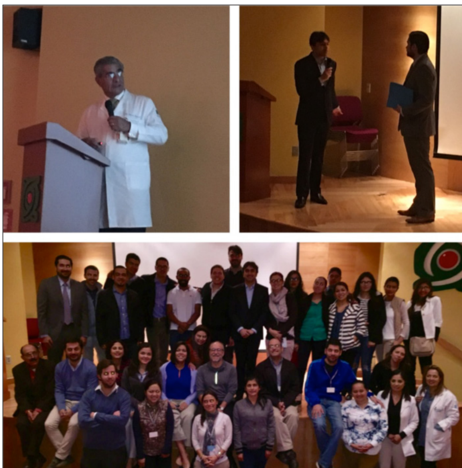
Figura 2. Asistentes y actividades realizadas en el IASP Pain Management Camp en la Ciudad de México (Octubre, 2016). Actividades en Instituto Nacional de Rehabilitación.

El dolor crónico es ahora reconocido como una condición que afecta a la salud por mérito propio. Este afección: 1) es común; 2) universal; 3) se identifica en todas las edades; 4) se ha documentado su presencia a lo largo de la historia; 5) impacta considerablemente la capacidad física de los sujetos que lo padecen; 6) interfiere con la “calidad de vida” (condiciones asociadas a la vida); 7) afecta la salud mental de sus portadores; 8) impacta en el balance económico de las